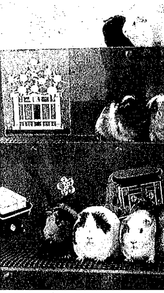
3月中旬まで公開されるテ ひな壇一狹山市智光山公園

は「地方議会においても緊張関係のある政治状況が望ましい。大事なのは選挙を通じて政策論争を起すこと。考え方が一致したので応援させていただくことにした」と胸を張った。 3期目の「最後」となる代表質問。眞議選と知事選という地方選のハイライトを控えながら型どおりのやりとりで終始し、あるベテラン眞議は「どっちも突っ