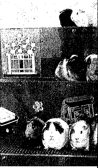
3月中旬まで公開されるテ ひな壇一狹山市智光山公園

「地方議会においても緊張関係のある政治状況が望ましい。大事なのは選挙を通じて政策論争を起すこと。考え方が一致したので応援させていただくことにした」と胸を張った。 3期目の「最後」となる代表質問。眞議選と知事選という地方選のハイライトを控えながら型どおりのやりとりで終始し、あるベテラン眞議は「どっちも突っ